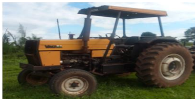
Imagem 01: Trator Valtra 785 - Coopraf.

A COOPRAF é permissionária de uma Patrulha Mecanizada, que tem por objetivo apoiar a agricultura familiar prestando serviços de preparo do solo, plantio, etc., contribuindo para geração de trabalho no campo e melhoria da qualidade de vida dos seus beneficiários. O Termo de Permissão de Uso está normatizado de acordo com o Artigo 14 da Lei Orgânica do Município de Tangará da Serra e Lei municipal nº 4.170/2013. A Patrulha mecanizada é composta por um conjunto de máquinas e implementos sendo: