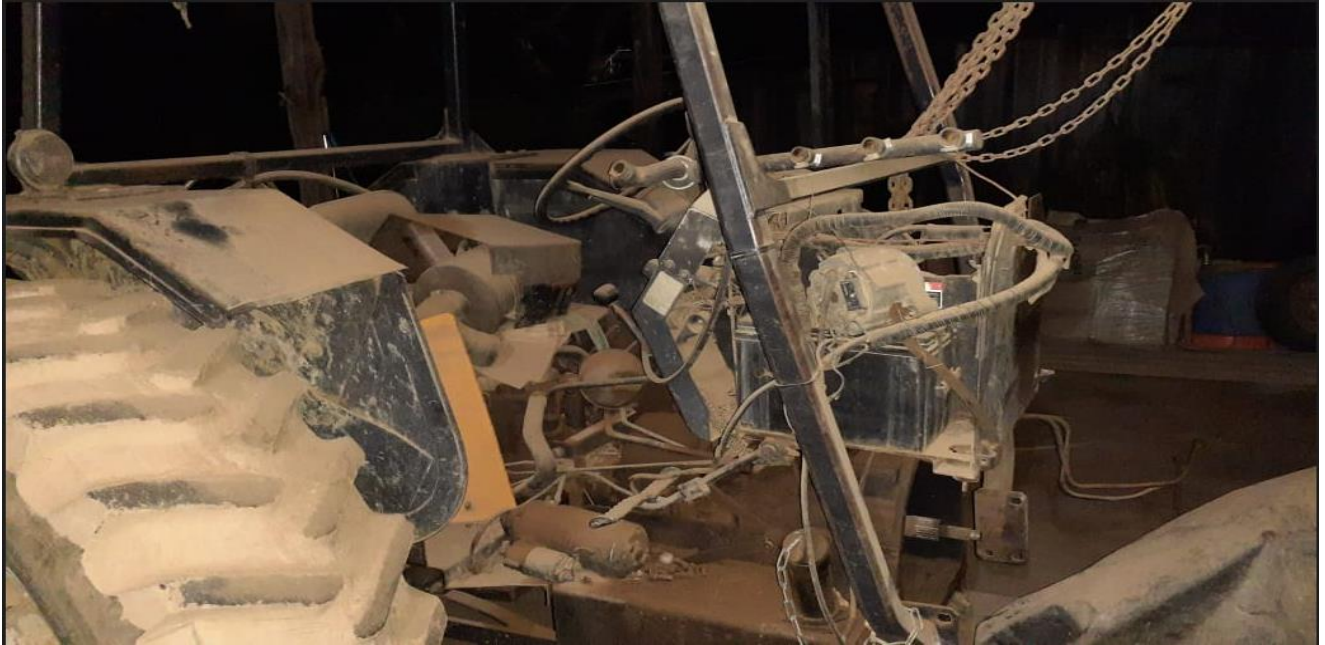
Imagem 02: Trator Valtra 785 demonstrado no aguardo de autorização para concerto.

A imagem a seguir ilustra o trator desmontado em uma mecânica local no aguardo de autorização para concerto. Mas, devido o custo estimado em R$ 7.000,00, a Coopraf não tem previsão de quando autorizará tal concerto. Em síntese, trancou o comando do motor (eixo virabrequim), sendo necessário aplainar cabeçote e revisar as sedes de válvulas dos quatro cabeçotes, válvulas e travas. Também será necessário trocar a bomba de óleo do motor (lubrificante).